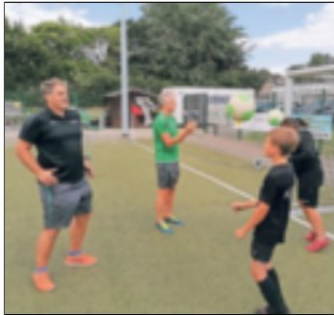
Trainieren mit den Profis!