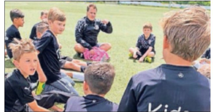
„Kids aktiv Hochneukirch“ sorgte für gelungene Tage rund um das Thema Fußball.