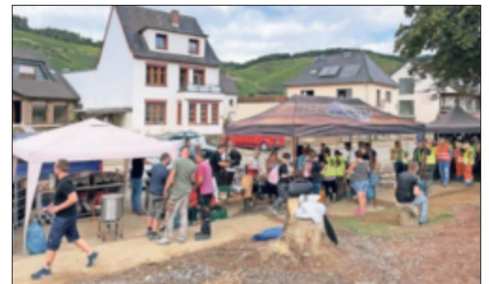
Viel los am Stand der Jüchener Griller. Die Hilfe wird gerne angenommen.

Dann war da noch die Frau um die 70, deren Nachbarn vermisst sind. Also kümmerte sie sich um den Garten – in der Hoffnung, dass sie bald wieder auftauchen. Doch wohin mit dem ganzen Gemüse aus dem Garten? „Ich möchte es euch spenden. Aber ich kann es nicht bringen. Die Flut hat mein Auto zerstört.“ Oder der alte Mann, der nur zögernd auf die Grillstation zukommt und vorsichtig anfragt, ob er auch eine warme Mahlzeit haben dürfe. Seine Frau sei vor zehn Jahren verstorben, seitdem habe er Essen über ei-