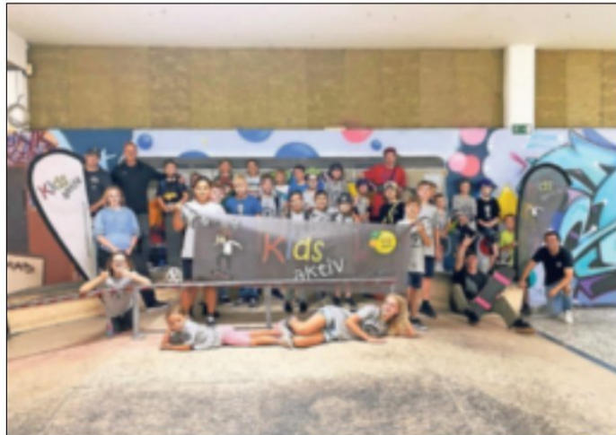
Bei der Rollbrett Union hatten die Kids viel Spaß. Ist der Fahrspaß bald auch in Hochneukirch möglich? Fotos: Kids aktiv HNK

Hochneukirch. Ganz schön viel los bei „Kids aktiv Hochneukirch“, dem Förderverein des VfB Hochneukirch. Feriencamps rund um den Fußball, das Tanzen und Hockey sorgten im Sommer schon für glückliche Kinder. Mit dabei im Angebot auch eine Premiere: das erste „Kids aktiv Skatecamp“! „Gemeinsam mit der Rollbrett Union aus Rheydt und vielen motivierten Kids haben wir eine tolle Woche verbracht. Auf den mobilen Rampen, welche wir in unmittelbarer Nähe des VfB-Sportparks aufgestellt haben, konnten die Kids die ersten Grundlagen erlernen. Danach besuchten wir verschiedene Skateparks aus der Region wie die Skateanlagen in Jüchen und